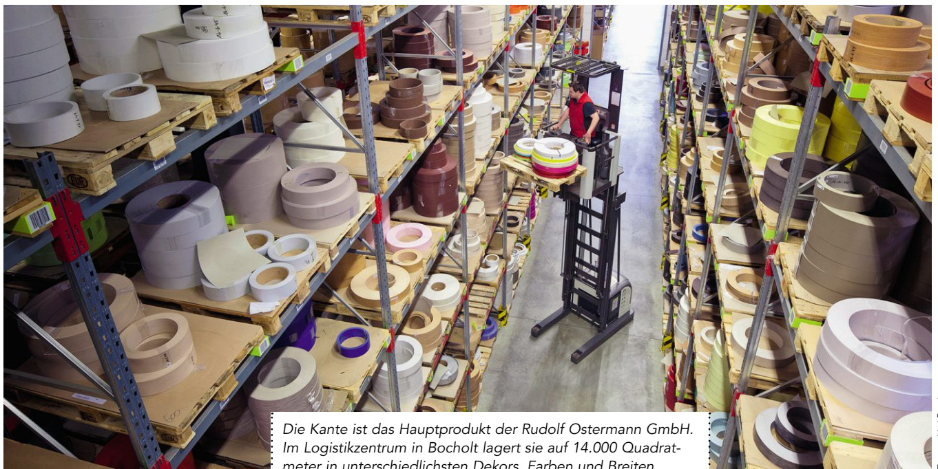
Die Kante ist das Hauptprodukt der Rudolf Ostermann GmbH. Im Logistikzentrum in Bocholt lagert sie auf 14.000 Quadratmeter in unterschiedlichsten Dekors, Farben und Breiten.

Bis zu 3.000 Bestellungen am Tag bearbeitet die Rudolf Ostermann GmbH im Distributionslager in Bocholt. Damit ist der Mittelständler europaweit der führende Versandhändler für Kanten und Beschläge. 33 UniCarriers-Geräte sorgen dafür, dass die Aufträge rasch kommissioniert und termingerecht in die Lkw verladen werden.